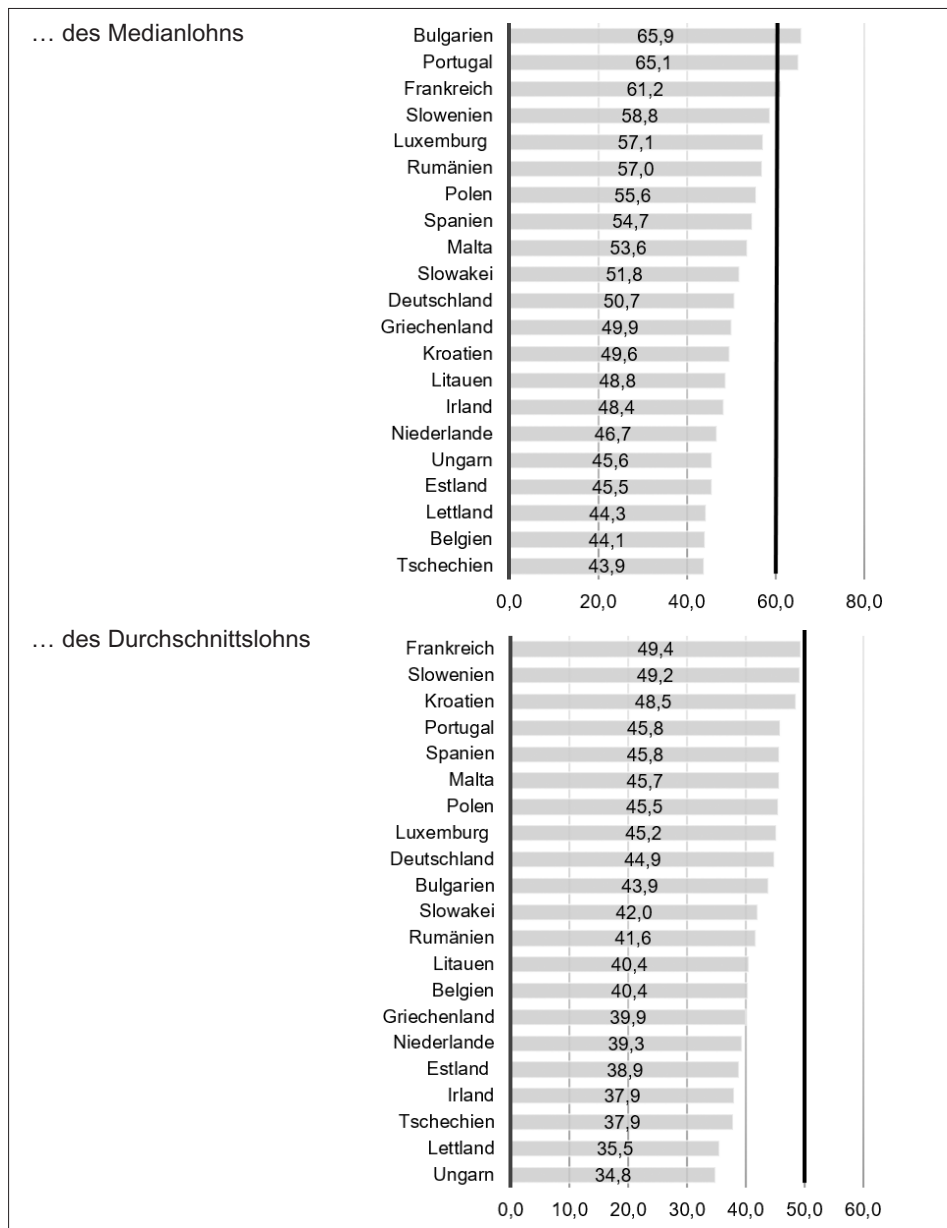
Abbildung 1: Gesetzliche Mindestlöhne in Prozent ... (2020)